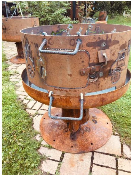
Massive Griffe für den Transport oder zum Einhängen des Grillbestecks