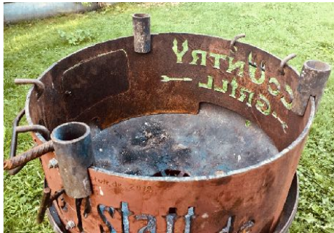
Abstandhalter für die Grillplatte + Abdeckung

Stahlblech 5 mm dick mit Löchern für zum Einhängen für den Transport