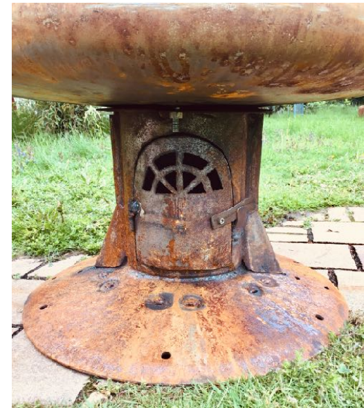
Aschekasten / Zuluftöffnungen