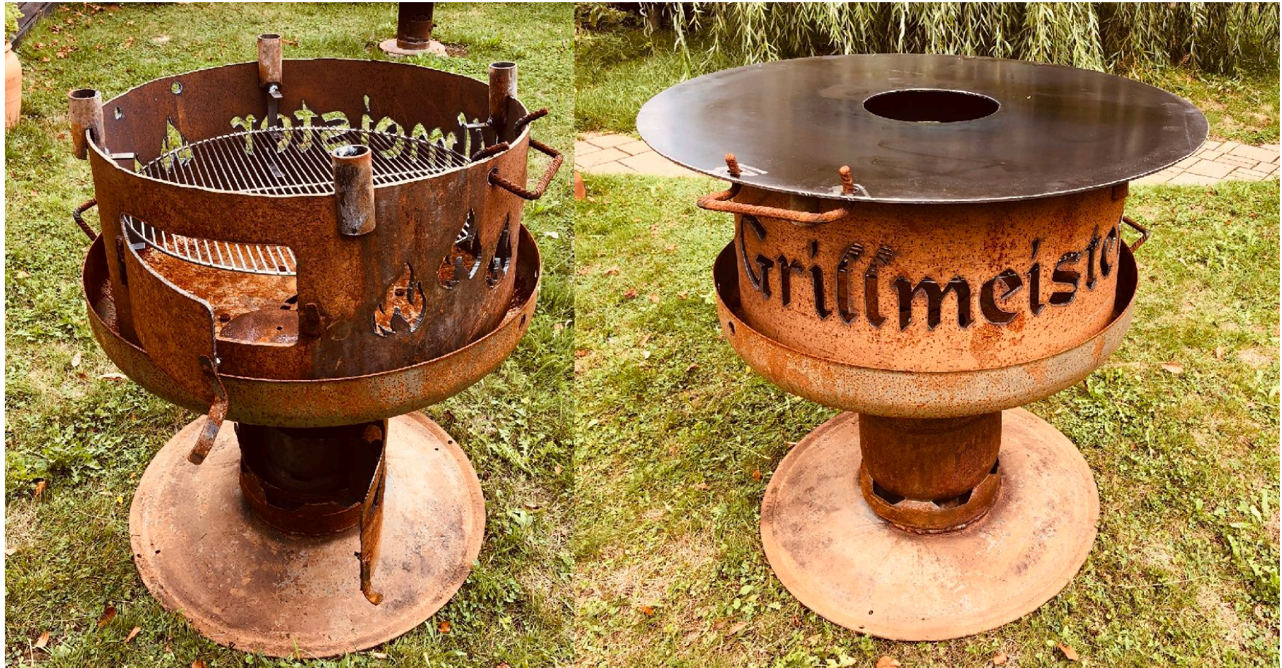
Großer Grill - D = 80 cm mit Grillplatte D = 95 cm