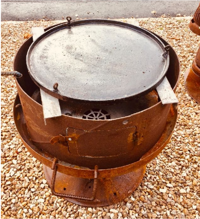
Gußpfanne Durchmesser ca. 60 cm mit 2 Haltestangen