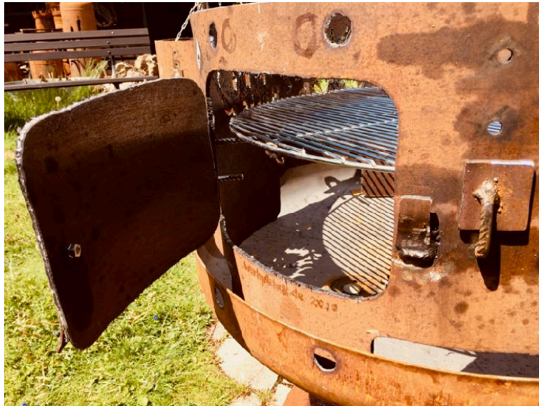
Seitliche Klappe zum Holzeinwurf