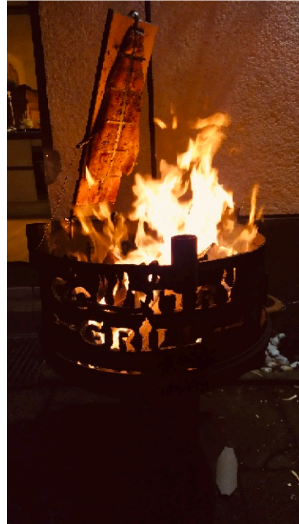
Mit Lachsflambrett 50 x 15 cm